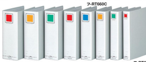
フ-RT6100C フ-RT690C フ-RT680C フ-RT670C フ-RT650C フ-RT640C フ-RT660C