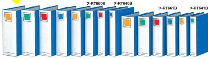
フ-RT6100B フ-RT690B フ-RT680B フ-RT670B フ-RT650B フ-RT630B フ-RT681B フ-RT671B フ-RT651B フ-RT631B