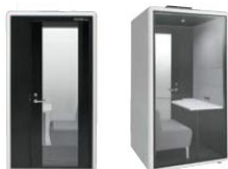
クリアタイプ(表) クリアタイプ(裏)

本体はこもり感の高いスタンダードタイプと、背面がガラスパネルで開放感のあるクリアタイプからお選びいただけます。